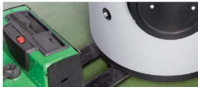
SISTEMA DE TRANSPORTE: Aberturas/conductos bajo el depósito para facilitar la manipulación con transpaletas (a partir de 1.500 litros).

Además disponen de cáncamos de elevación en la parte superior, para el caso de necesidad de ubicación del depósito en zonas elevadas y tener que ser izado con pluma de carga.